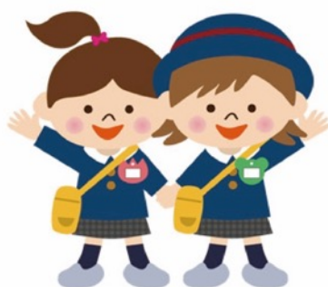
幼児期 (小学校入学前)