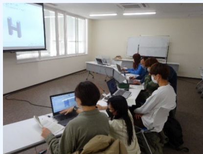
写真： SolidWorks（ソリッドワークス）の基本操作の習得中、H形状のモデリングを学んでいます。二次元と三次元への変換を相互に確認しながら作成していきましました。

○事前学習回 1月15日（日）もしくは21日（土） 会場：鈴鹿工業高等専門学校 10:00～17:00 CAD実習（ソリッドワークス）