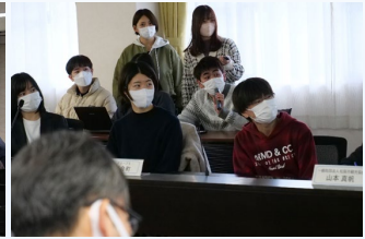
写真右：玉城町チームの発表の様子