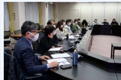
写真左： 総括する先生方

鋭い指摘をたくさんいただきました。スリランカ、台湾の留学生も頑張って回答しました。