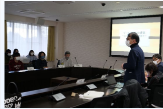
写真左：開会のあいさつをする様子