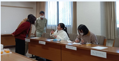
写真： 試食して三重大生に講評するベトナム人留学生 北部・中部・南部出身者によって食べる習慣や嗜好が異なるようです。

東紀州の特産品である柑橘を使った新商品開発に係るテイasting調査とベトナムへの輸出を視野に入れてベトナム人留学生を対象に試食会を開催しました（詳細はVol.26参照）。本試食会の結果、商品は「みかんジャム」と「果汁漬けコンポート」に決定しました。現在、容器とデザイン、価格などについて検討しています。2月12日（日）、多気VISONにて販売とプレスリリースを予定しています。