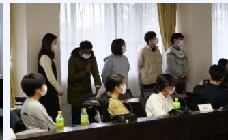
写真：プレゼンの様子と聞き入る学生たち